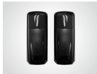
Lichtschranke LS 5F