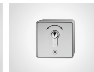
Schlüsseltaster KT 8 AP