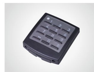
Außentaster DigiCode Premium

Metalltastatur, 433 MHz, mit KeeLoq-Wechselcode, AES