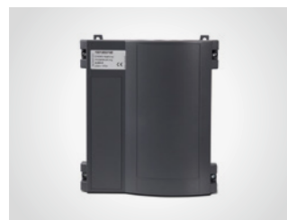
Ampelsteuerung A 800 III

Für BLACK 1200, mit 10 m Anschlusskabel, ohne Funkempfänger