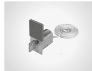
Notentriegelung mit Profilhalbzylinder

Für doppelflügelige Tore, Deckengliedertore und Sektionaltore