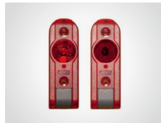
Integrierte Lichtschranke LS 2-I

2-Draht, Reichweite 8 m, für Innenbereiche