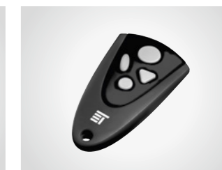
Handsender MAX 43-4

4-Kanal Handsender, 433 MHz, mit KeeLoq-Wechselcode