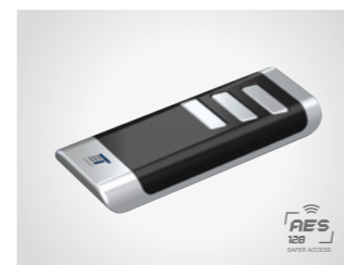
Handsender BLACK Remote

3-Kanal Handsender, 433 MHz, mit KeeLoq-Wechselcode, AES