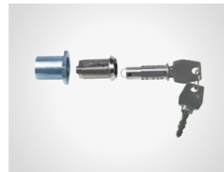
Notentriegelung mit Rundzylinder

Für doppelflügelige Tore, Deckengliedertore und Sektionaltore