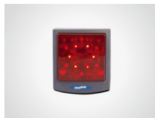
Signalleuchte LED Rot

Blinken oder Dauerlicht einstellbar, 24 V AC/DC