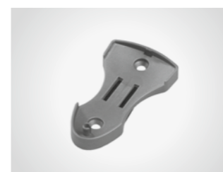
Wandhalterung für Handsender

Mit Sonnenblendclip, für MAX 43-2/-4 (1) und MIX 43-2 (2)