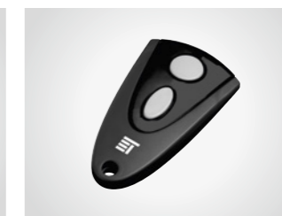
Handsender MAX 43-2

2-Kanal Handsender, 433 MHz, mit KeeLoq-Wechselcode